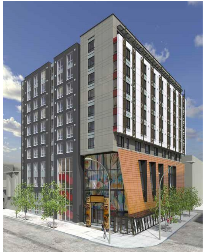
▲ 擬議社區重建項目模擬圖