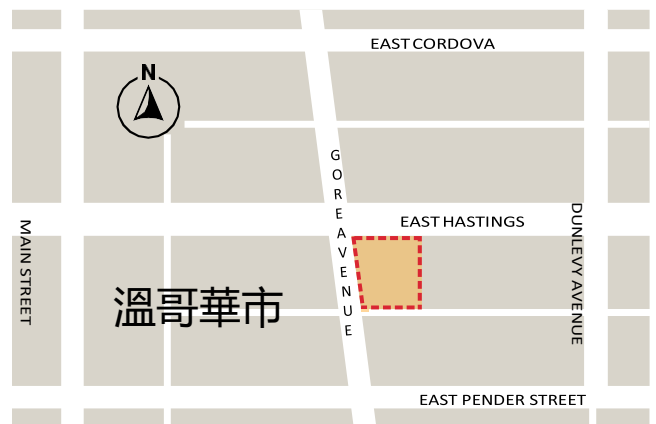
▲ 擬議社區重建項目模擬圖